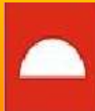
zestaw sprzętu p. poż.