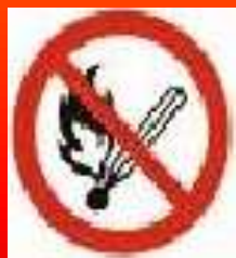
zakaz używania otwartego ognia