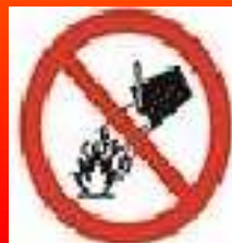
zakaz gaszenia wodą