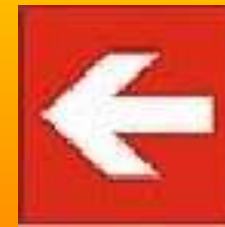
kierunek do miejsca sprzętu p.poż.