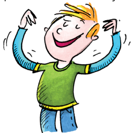
Moje mocne strony

4. Zapisz w punktach informacje o sobie. Podaj podobną liczbę informacji po obu stronach.